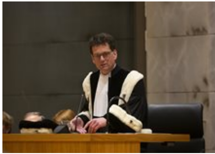
Procureur-generaal Edwin Bleichrodt

Een zelfstandig onderdeel binnen de Hoge Raad is het parket met aan het hoofd de procureur-generaal. Van het parket maken naast de procureur-generaal en de plaatsvervangend-procureur-generaal, advocaten-generaal (AG) deel uit. Het parket is onafhankelijk en maakt geen deel uit van het Openbaar Ministerie. Het parket is onderverdeeld in drie secties: civiel recht, strafrecht en belastingrecht. De belangrijkste taak van het parket is het geven van juridische adviezen in zaken, zogenoemde conclusies, aan de Hoge Raad. Die worden door de leden van het parket in onafhankelijkheid genomen. In totaal werden in 2022 1304 conclusies genomen: 382 in civiele zaken, 809 in strafzaken en 113 in belastingzaken.