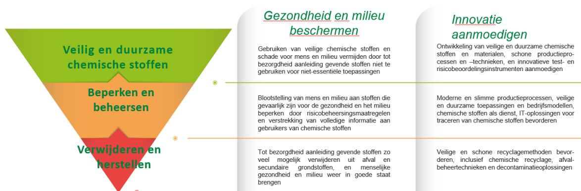
Figuur: De giftvrije hiërarchie — een nieuwe hiërarchie in het beheer van chemische stoffen

manier die hun bijdrage aan de samenleving (inclusief de groene en digitale transitie) maximaliseert en tegelijkertijd schade aan de planeet en de huidige en toekomstige generaties voorkomt. De strategie ziet de EU-industrie als een speler die op wereldschaal concurrerend is in de productie en het gebruik van veilige en duurzame chemische stoffen . In de strategie wordt een duidelijk stappenplan en een tijdschema voorgesteld voor de transformatie van de industrie met het oog op het aantrekken van investeringen in veilige en duurzame producten en productiemethoden.