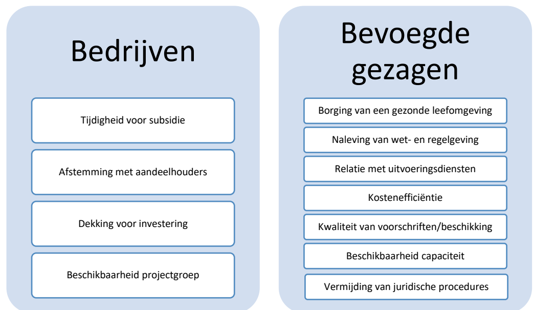
Figuur 2: de belangen die bedrijven en bevoegde gezagen hebben bij snelle vergunningprocedures

Bedrijven en overheden hebben in het kader van vergunningverlening verschillende belangen. Uiteindelijk hebben beide partijen wel dezelfde onderliggende behoefte; zekerheid, duidelijke en transparante besluitvorming.